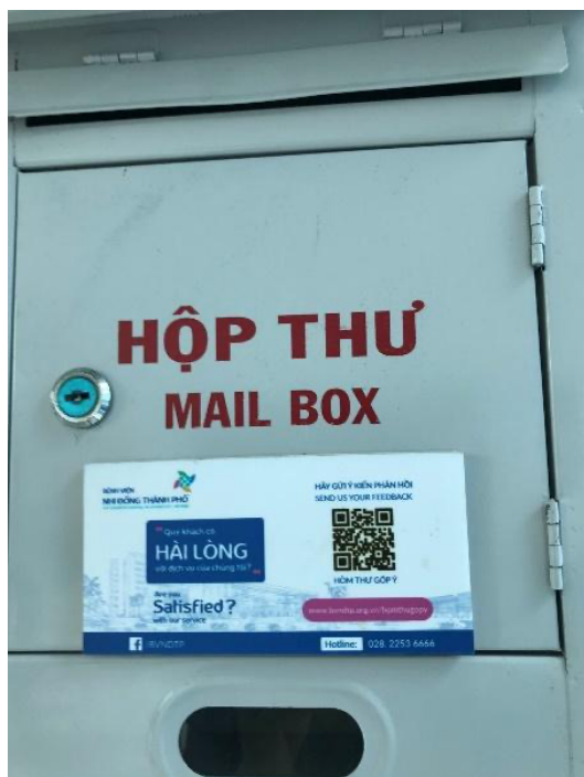
Hình 1: Thùng thư góp ý của Bệnh viện Nhi đồng Thành phố theo quy định của Bộ Y tế (tiếp thu qua giấy) kết hợp với mã QR để tiếp nhận ý kiến góp ý qua dữ liệu điện tử

Bên cạnh việc tiếp thu ý kiến của người bệnh thông qua hệ thống thùng thư góp ý như quy định của Bộ Y tế nêu trên, với tinh thần cầu thị và lắng nghe ý kiến người bệnh, cung cấp nhiều phương thức giao tiếp để người bệnh, người nhà người bệnh có thể thuận lợi trong việc góp ý để cùng xây dựng Bệnh viện Chấn thương Chỉnh hình ngày càng phát triển. Tiếp thu và học hỏi việc sử dụng mã QR để tiếp nhận ý kiến góp ý của người bệnh, người nhà người bệnh thông qua phương thức điện tử tại một số Bệnh viện bạn như Bệnh viện Nhi đồng Thành phố.