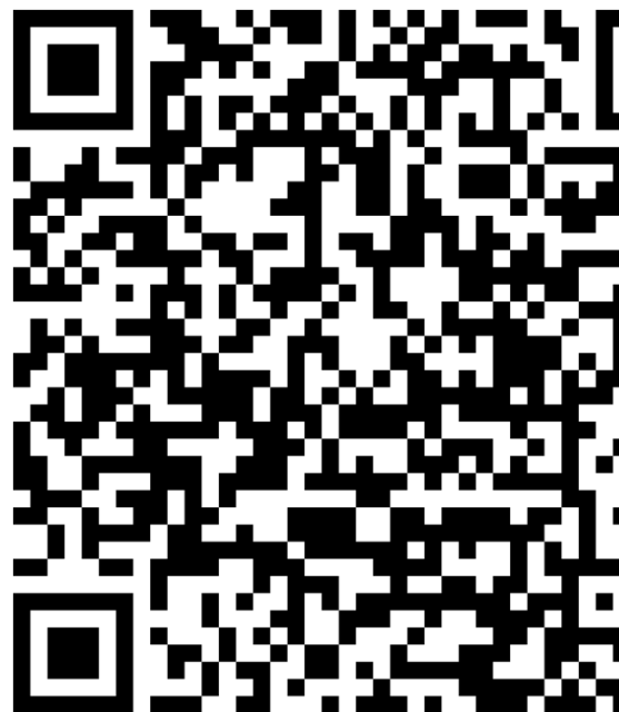
Hình 3: QR code đăng ký khóa học